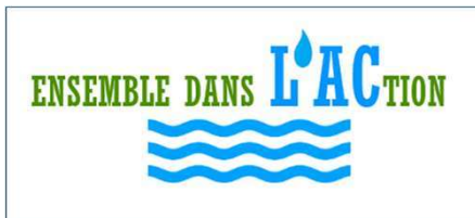
TABLE DE CONCERTATION